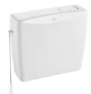
Cisterna alta/semi alta de plástico de doble descarga 6/3L para inodoro de tanque alto